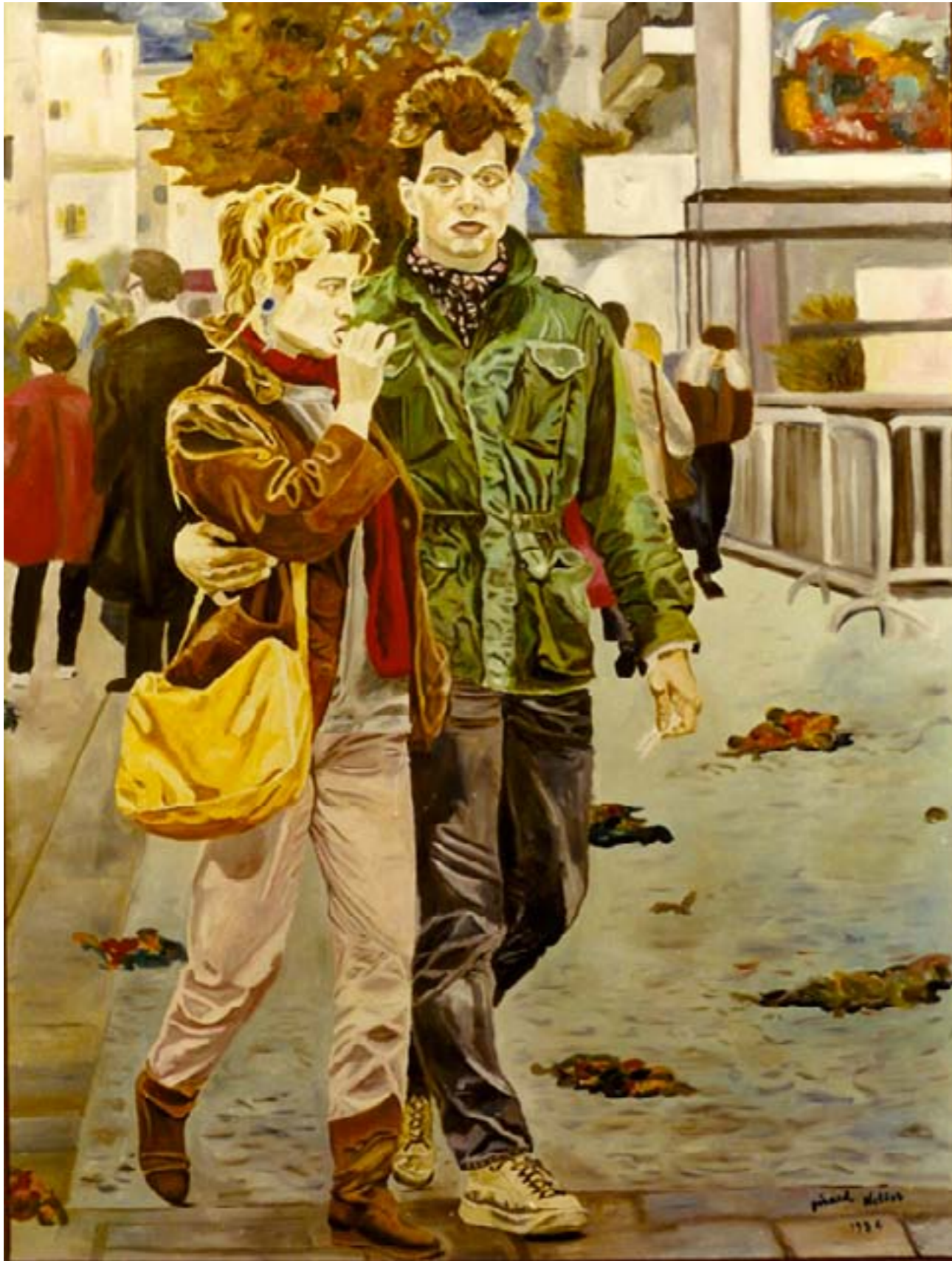
Le loup – huile sur toile – 130 x 97 cm

Elle est bien loin de ses cyprès Et de sa méditerranée, Elle s'est enfuie seule avec lui Pour faire des études à Paris.