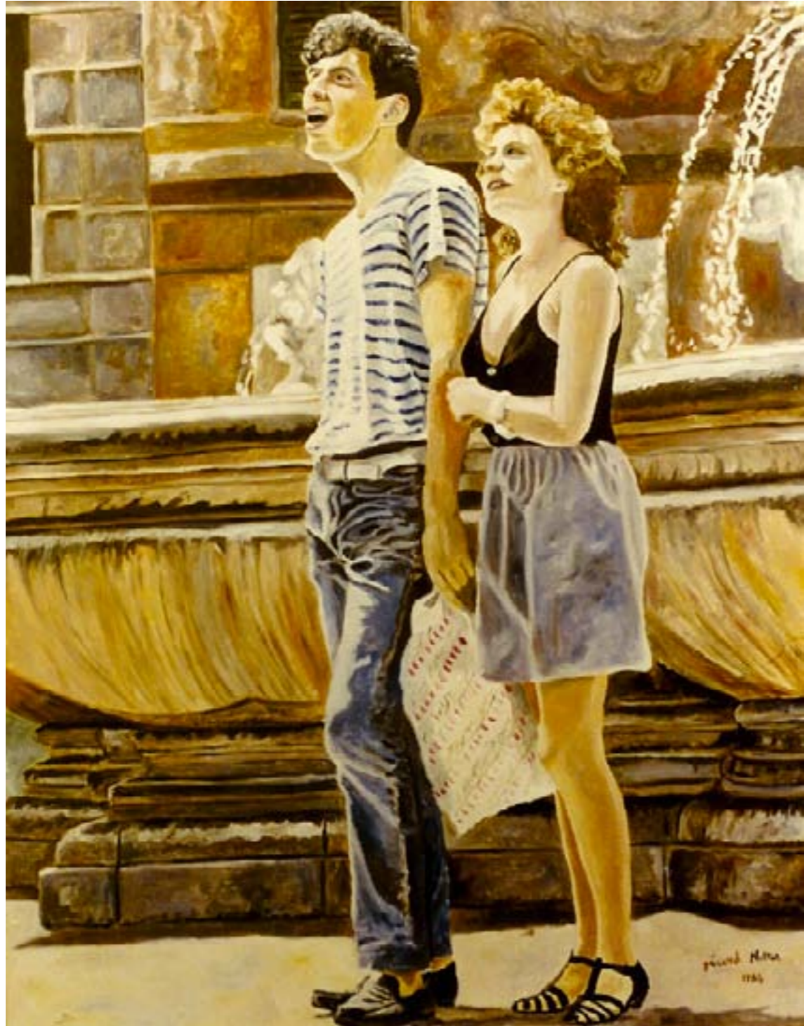
Bouches bées – huile sur toile – 116 x 89 cm

Ces deux-là, sidérés, bouche ouverte, restent cois, Ebahis l'un et l'autre par un « je-ne-sais-quoi » Médusés et figés, Surpris, époustouffés, Captivés, sous le charme d'un spectacle invisible.