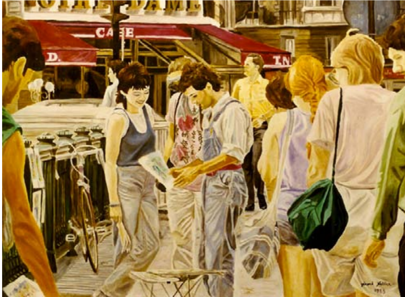
L'aquarelliste – Huile sur toile – 130 x 89 cm

Sur le pont Notre-Dame, un jeune aquarelliste, Poète, troubadour, au milieu des touristes Captive une passante, au délicieux sourire, Avec un paysage, qui semble la séduire .