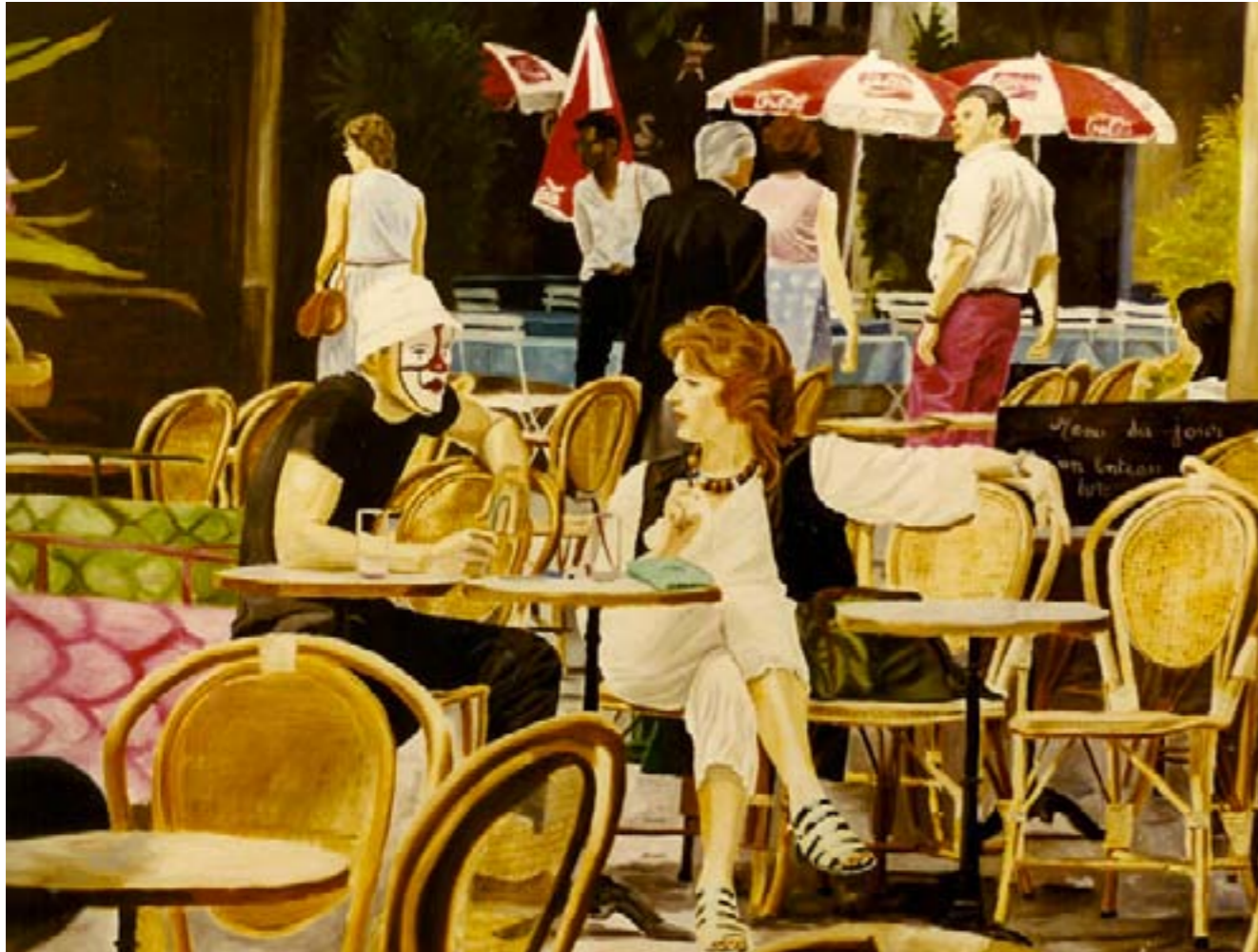
Le clown – huile sur toile – 130 x 97 cm -

Le clown s'est arrêté après son tour de piste Et il s'en est allé, dans la rue, un peu triste. Le spectacle du monde, ne le faisait pas rire Et le blues le gagnait, il voulait s'étourdir.