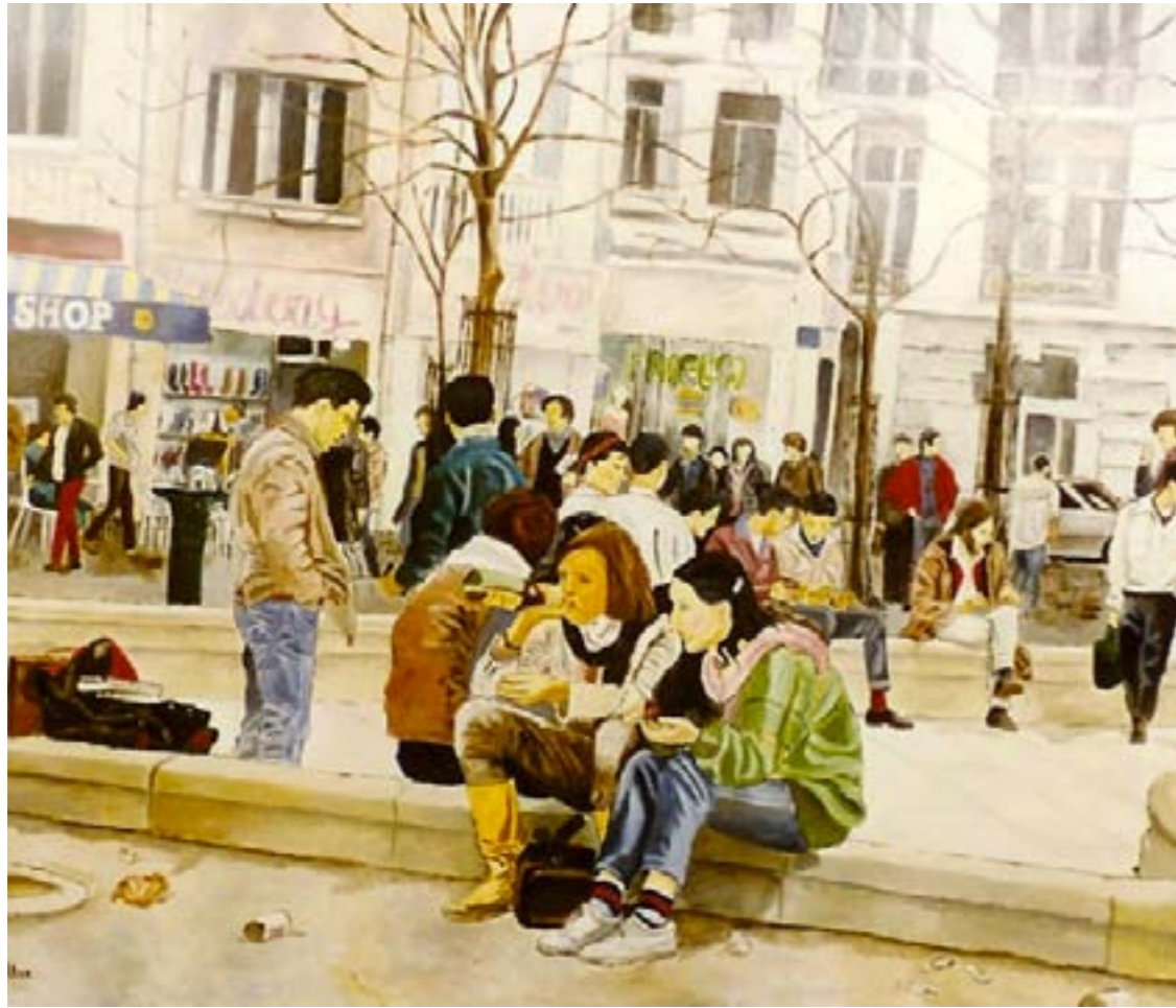
Place des Innocents – huile sur toile – 100 x 81 cm

Beaucoup de monde au cimetière A l'enterrement de mon jeune frère.