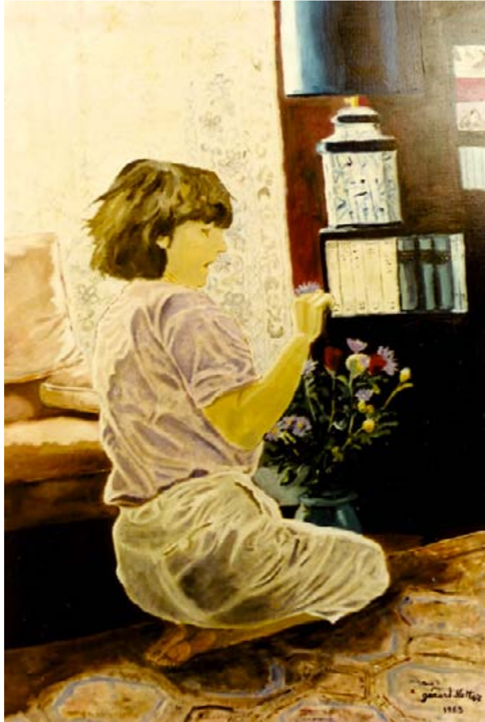
Elle avait un secret – huile sur toile – 92 x 65 cm

Elle avait un secret, qui semblait gros et lourd, Laisant le goût, en bouche, d'une blessure d'amour.