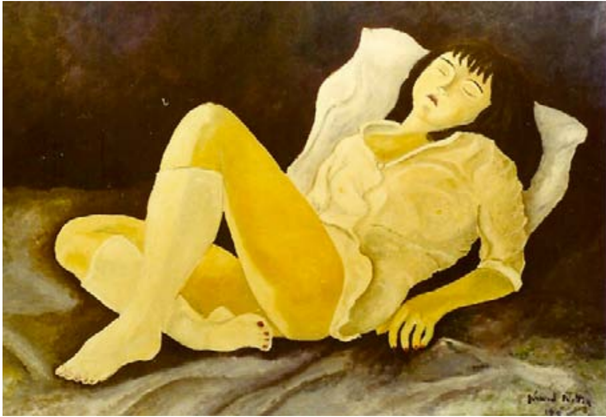
Dans tes rêves – huile sur toile – 61 x 45 cm

Tu es divine sur le divan La tête posée sur le coussin,