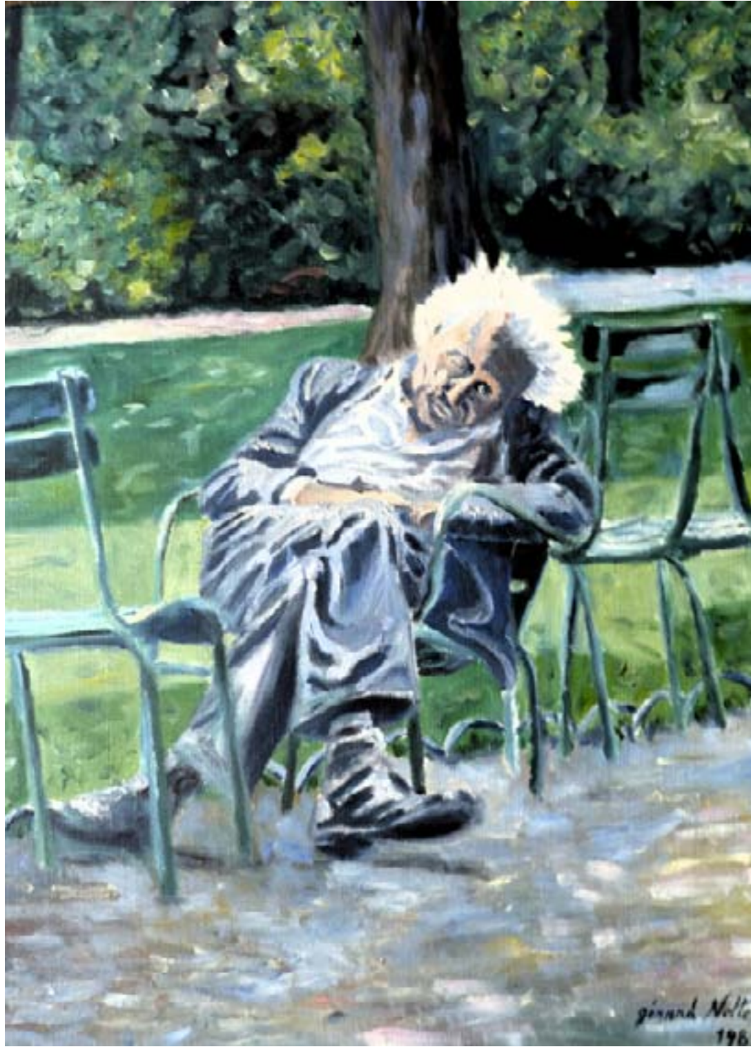
Un passé en trompe-l'oeil – huile sur toile – 61 x 48 cm

Dans un jardin public, un homme est assoupi Il porte en lui le livre des actes accomplis Et tandis qu'il somnole, assis dans un fauteuil, Son passé mouvementé se dessine en trompe-l'oeil