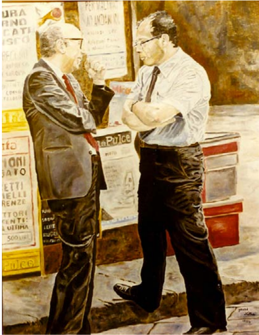
Confidences gourmandes - Huile sur toile - 116 x 89 cm

Deux compères se retrouvent un jour sur un trottoir Et, tout en gourmandise, se racontent l'histoire D'un amour dévoyé, qui met l'eau à la bouche, Et qui laissa un jour l'un des deux sur la touche