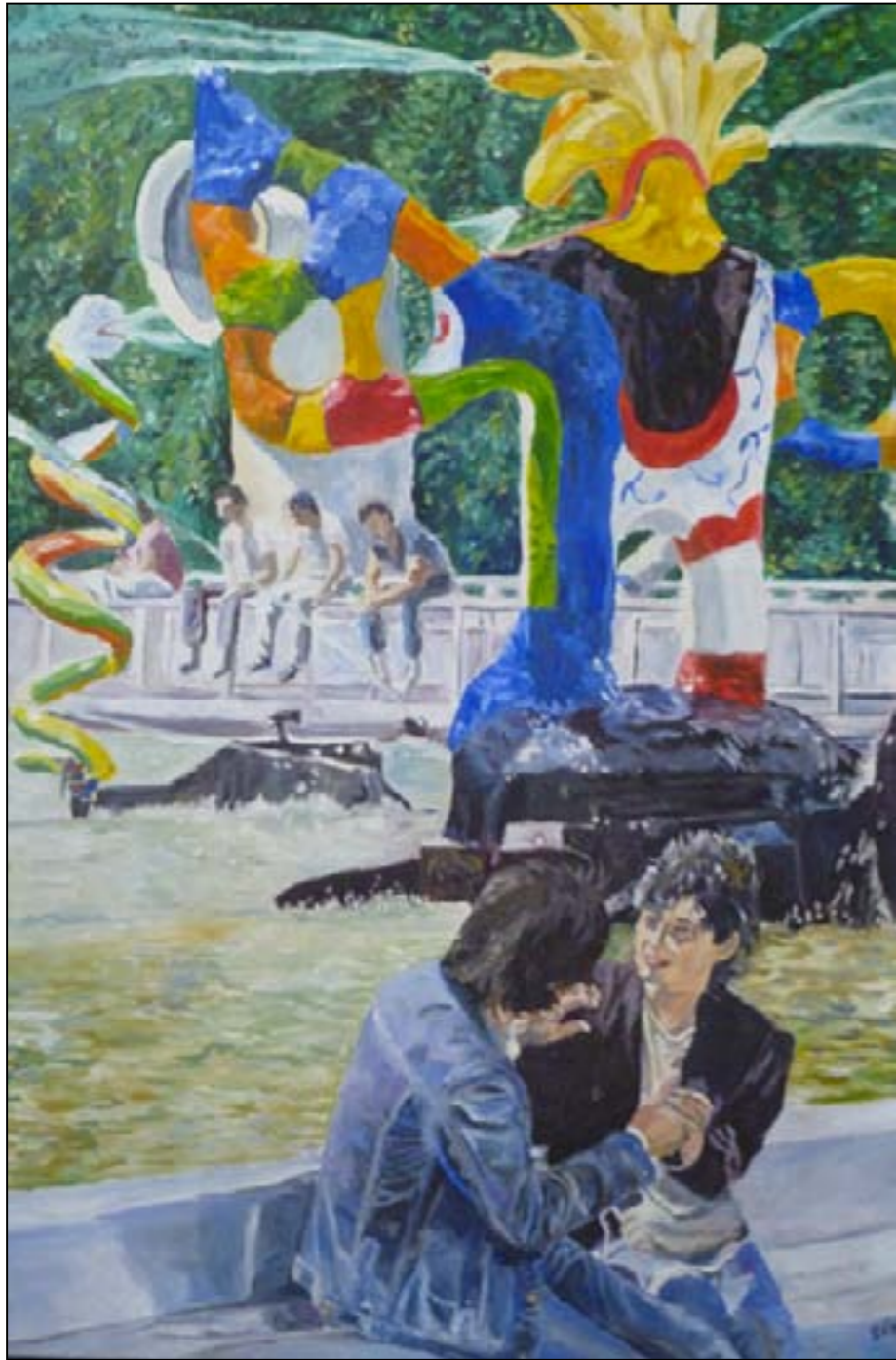
Le souffle de l'extrême vulnérabilité – huile sur toile – 73 X 54 cm

Avec au bout des doigts des perles de tendresse Elle tricote avec lui des projets, des promesses, Des rêves de velours en brume de dentelles, Les traces d'un éphémère, qui se veut éternel.