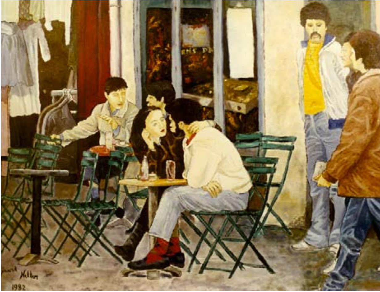
Une bulle multicolore – huile sur toile – 100 x 73 cm

Il lui parlait déjà, depuis plusieurs semaines, Tapotant le clavier dans un monde virtuel, Quand il eut cette envie de rencontre avec elle, Craignant que, sans cela, ses paroles ne soient vaines