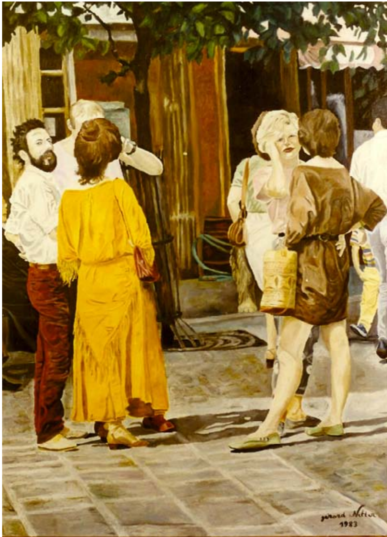
Un beau jour – huile sur toile – 116 x 80 cm