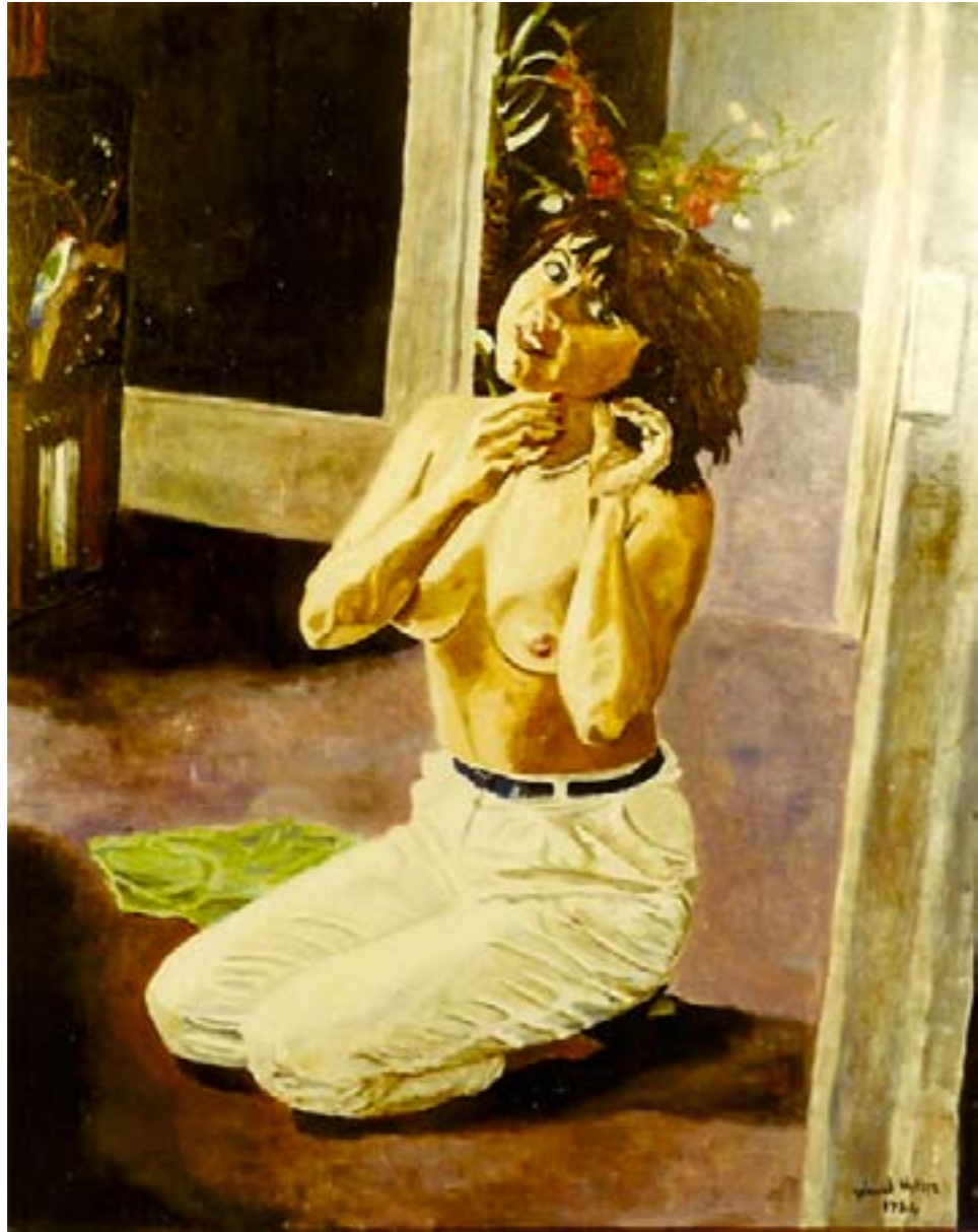
Sur le rebord du temps – huile sur toile – 73 x 60 cm

Le passé est trop lourd, l'avenir illusoire Ce que l'on croit acquis, un jour nous laisse choir Il faut être léger pour jouir du moment Il y a du tragique, même chez les amants