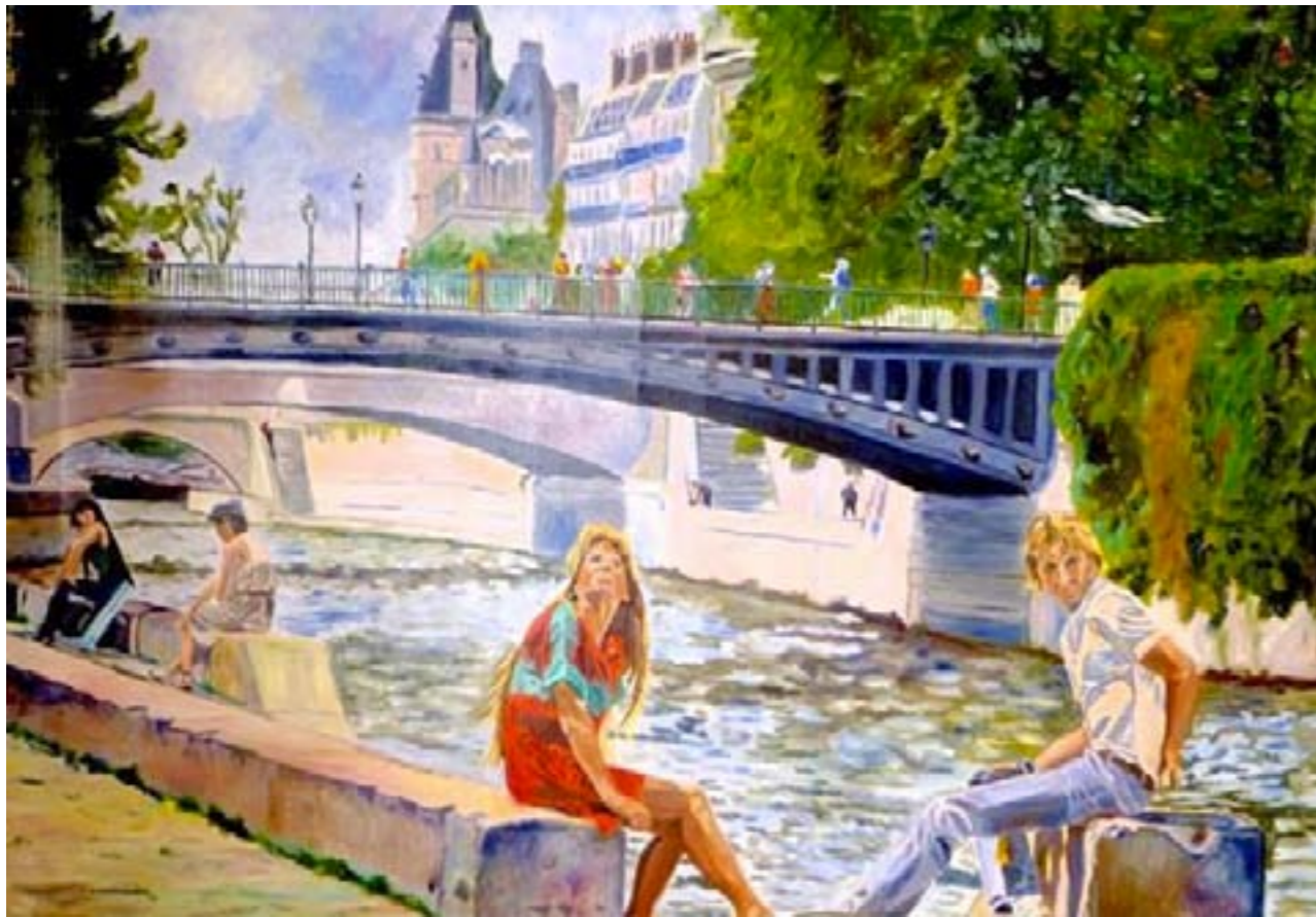
La dispute – huile sur toile – 100 x 81 cm

Et pourtant, la journée a très bien commencé, Ils sont très amoureux, ils se sentent légers. Le soleil chauffe encore, c'est la fin de l'été