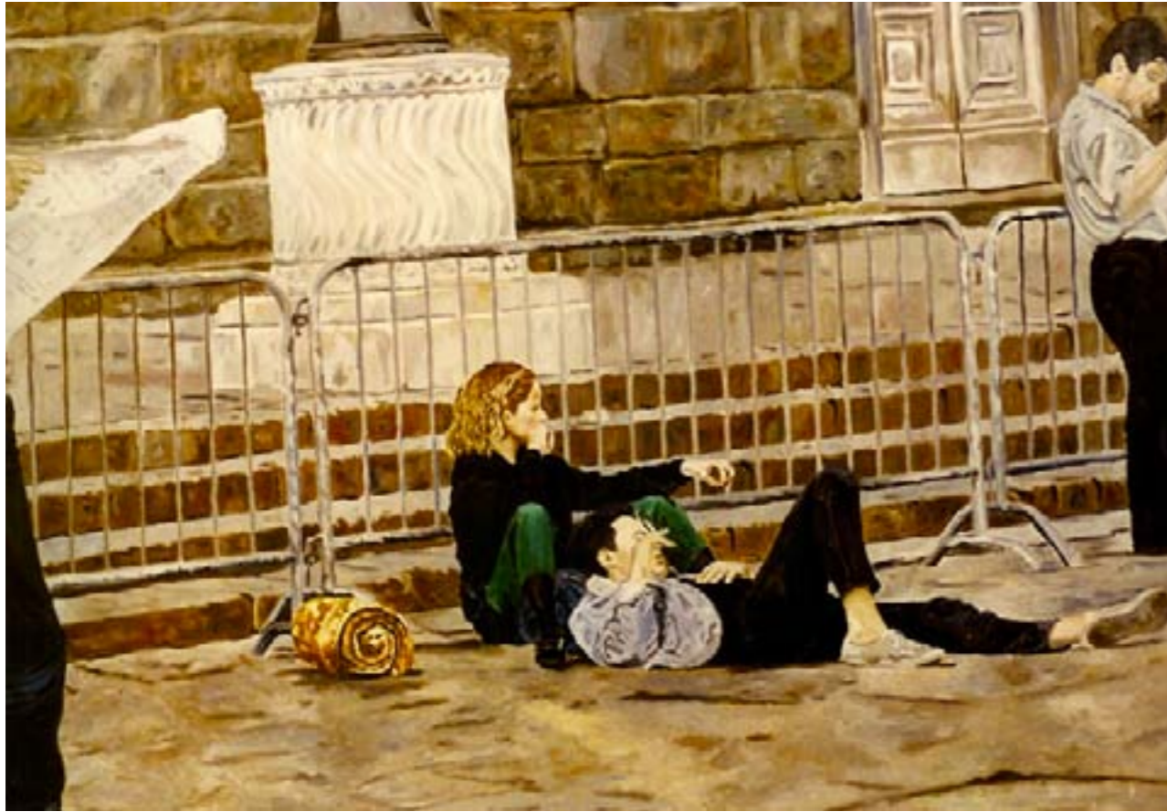
La fugue – huile sur toile – 130 x 80 cm

Ils sont partis sans partition, Improvisant sans provision Une escapade, Quelques arpèges, Une parenthèse de velours, Un délice, à crever d'amour.