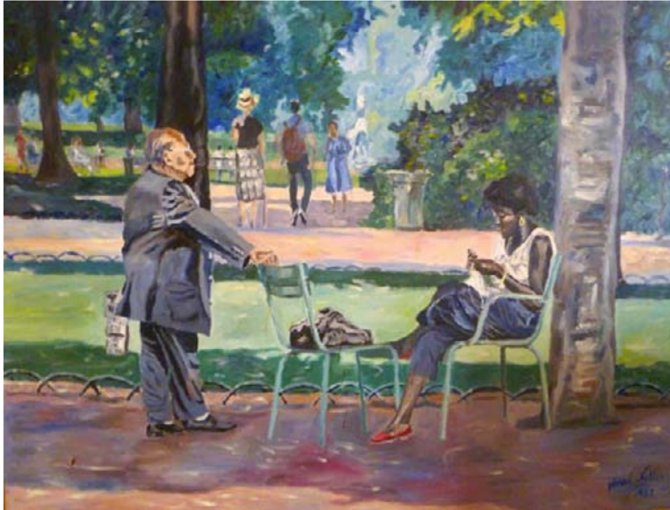
Les escarpins rouges - huile sur toile - 92 x 60 cm

Elle a mis, ce jour-là, De beaux escarpins rouges Pour écraser son désespoir.