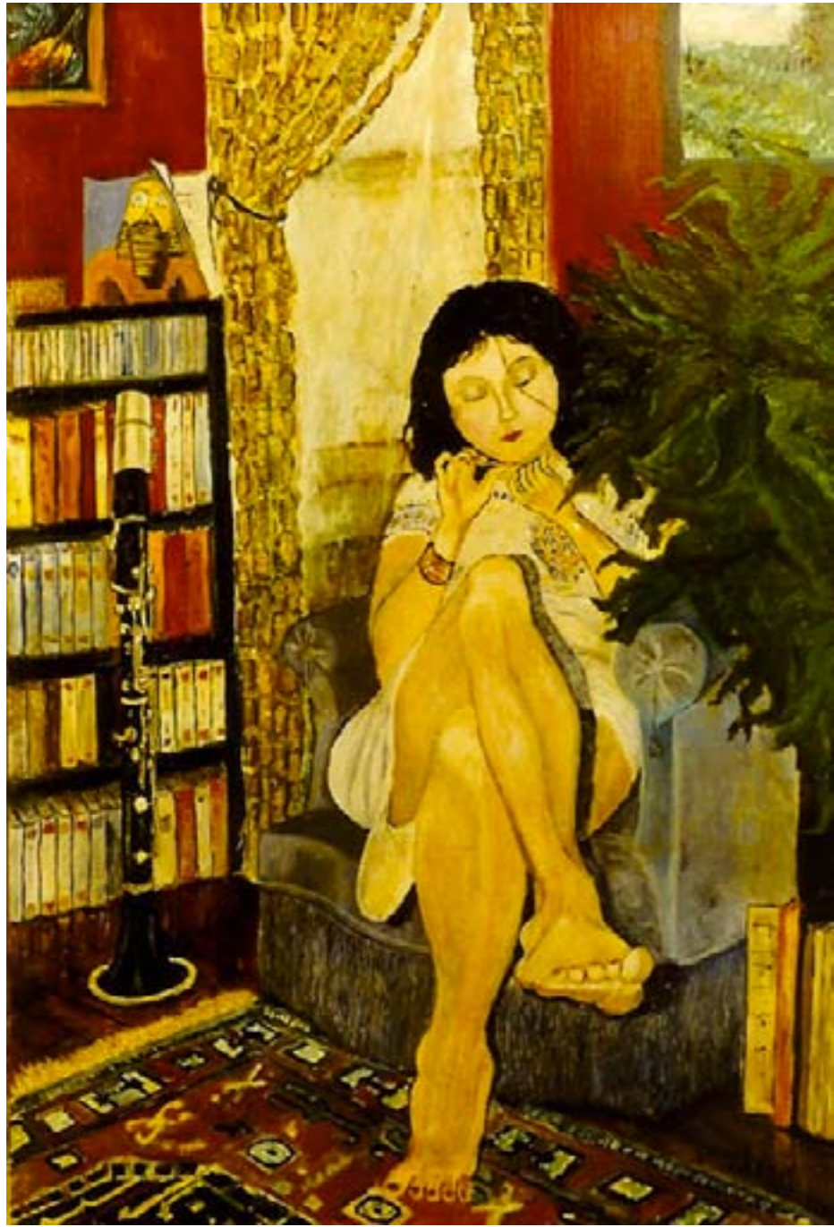
Le rendez-vous – huile sur toile – 73 x50 cm

Elle se lime les ongles dans le petit salon Écoute de la musique, et tourne un peu en rond. L'homme qu'elle a rencontré, hier soir à l'opéra Lui a fait un effet dont elle ne revient pas.