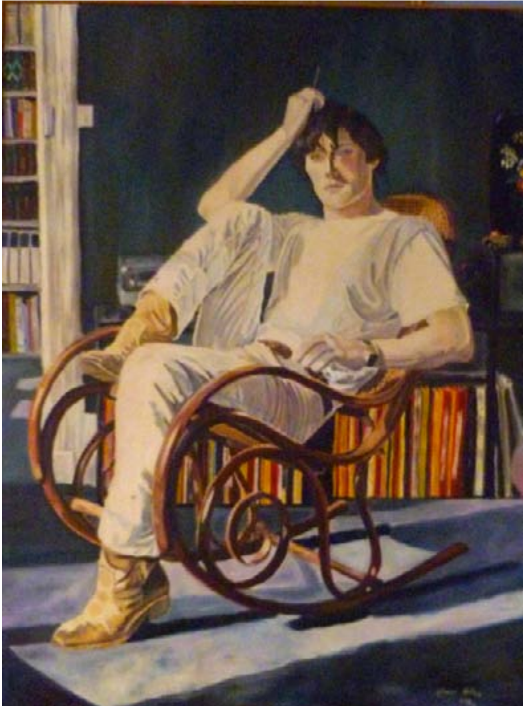
Sur le rocking-chair – huile sur toile – 116 x 89 cm

Il se balance sur le fauteuil Et il hésite entre deux voie Il a le choix, il ne sait pas S'il doit aller ici ou là