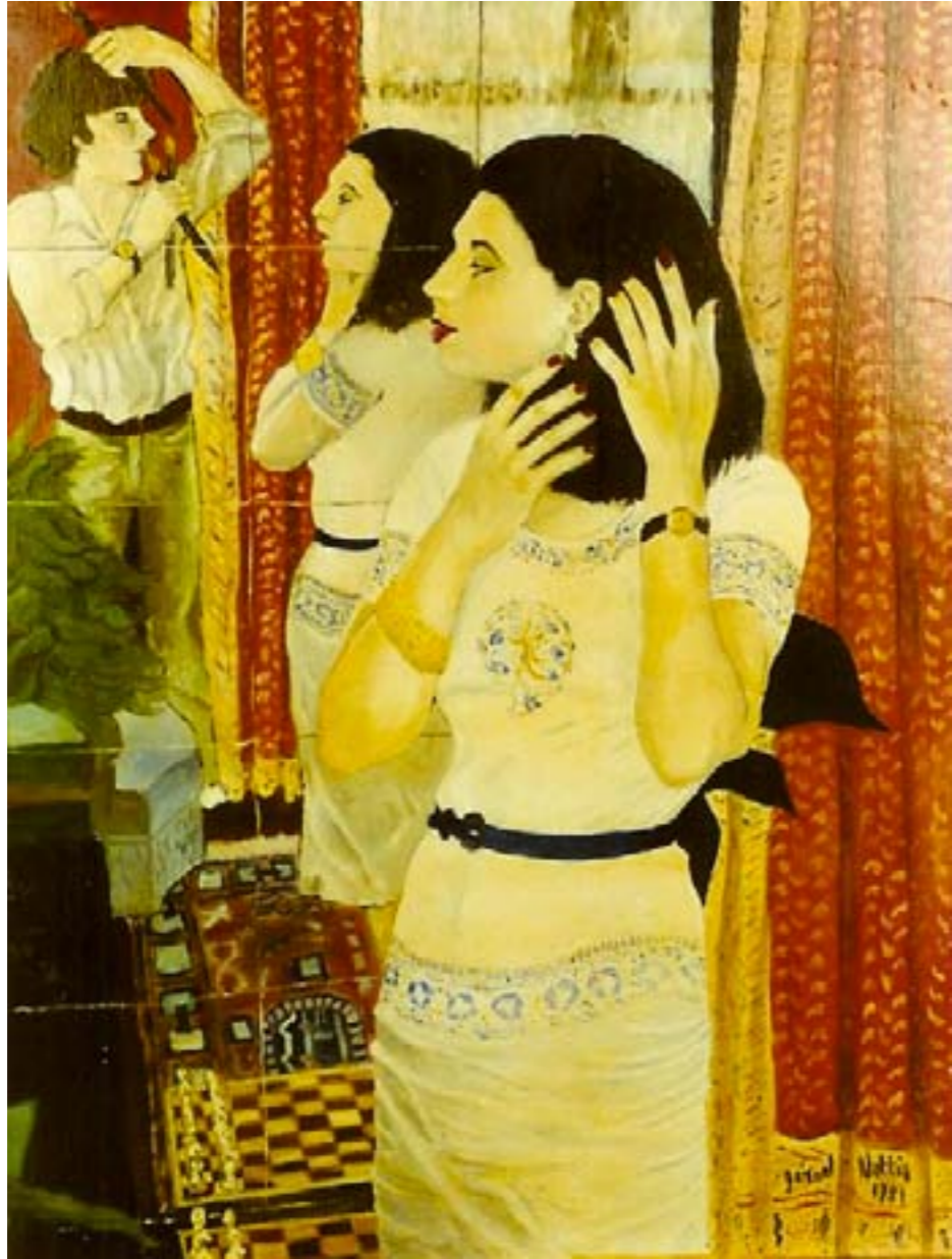
Profil – huile sur toile – 61 x 46 cm

La brune prend la pose, elle se trouve belle Elle veut bien qu'il la croque, car il craque pour elle. A l'aide de son pinceau, il mélange les huiles, Elle joue à l'égyptienne et se met de profil