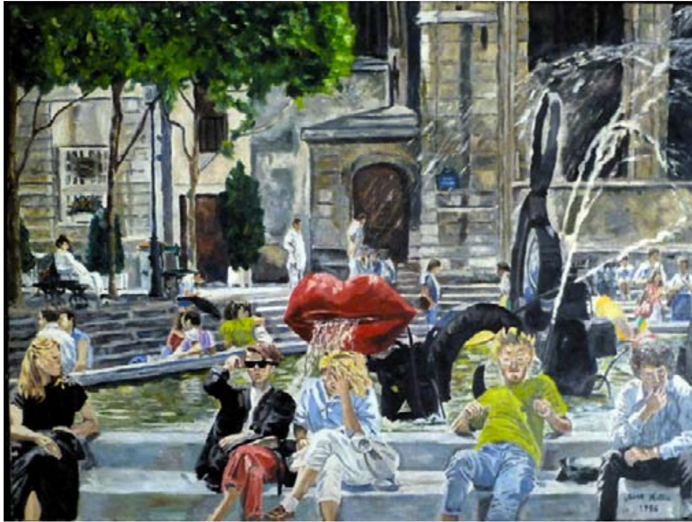
Le cœur en fête – Huile sur toile - 81 x 60 cm

Je flâne, je m'arrête, je marche d'un pas lent En me laissant porter par le flux des passants Le temps est à l'errance Et ça sent les vacances.