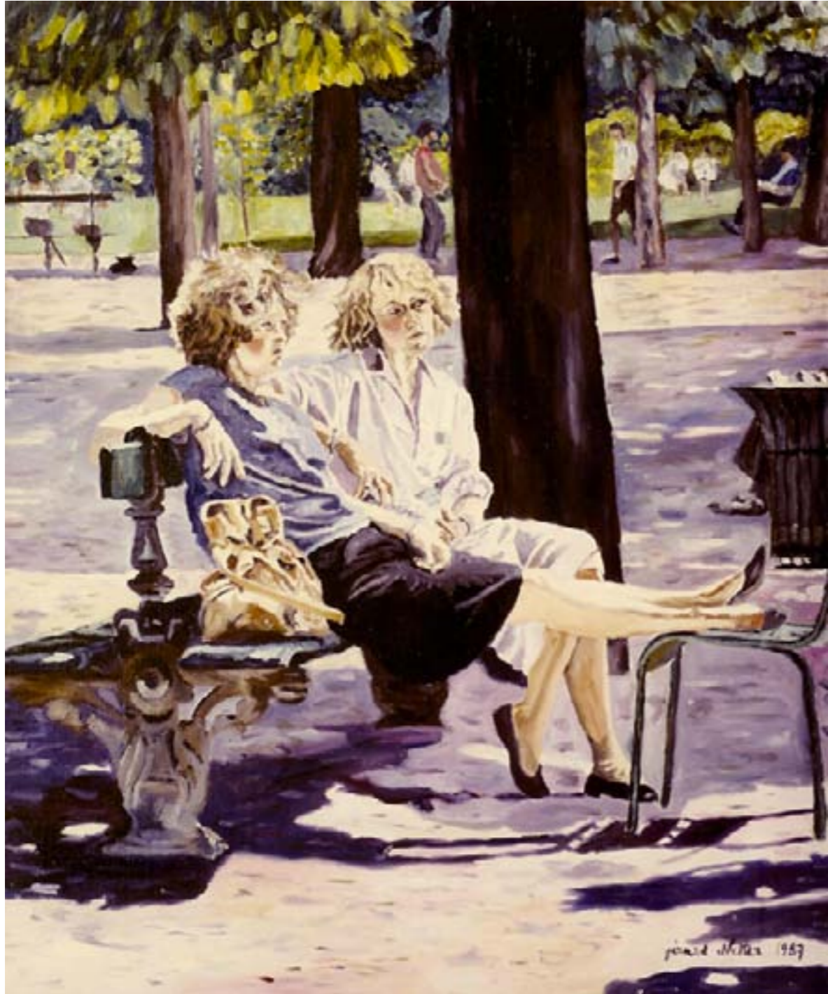
Son coeur est déchiré – huile sur toile – 81 x 60 cm

Il pleut fort ce jour-là et elle marche dans les flaques Elle a pris sa valise et ses cliques et ses claques, Elle a jeté la clef pour ne plus revenir Puis, elle s'est dirigée vers la gare pour partir