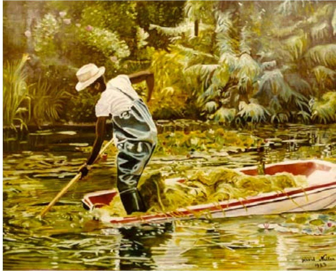
Giverny blues – huile sur toile – 130 x 97 cm

A la fin du printemps, un bel après-midi, J'étais allé flâner, pour faire l'impressionniste, Et retrouver un peu le talent de l'artiste, A la maison de Claude Monet, à Giverny.