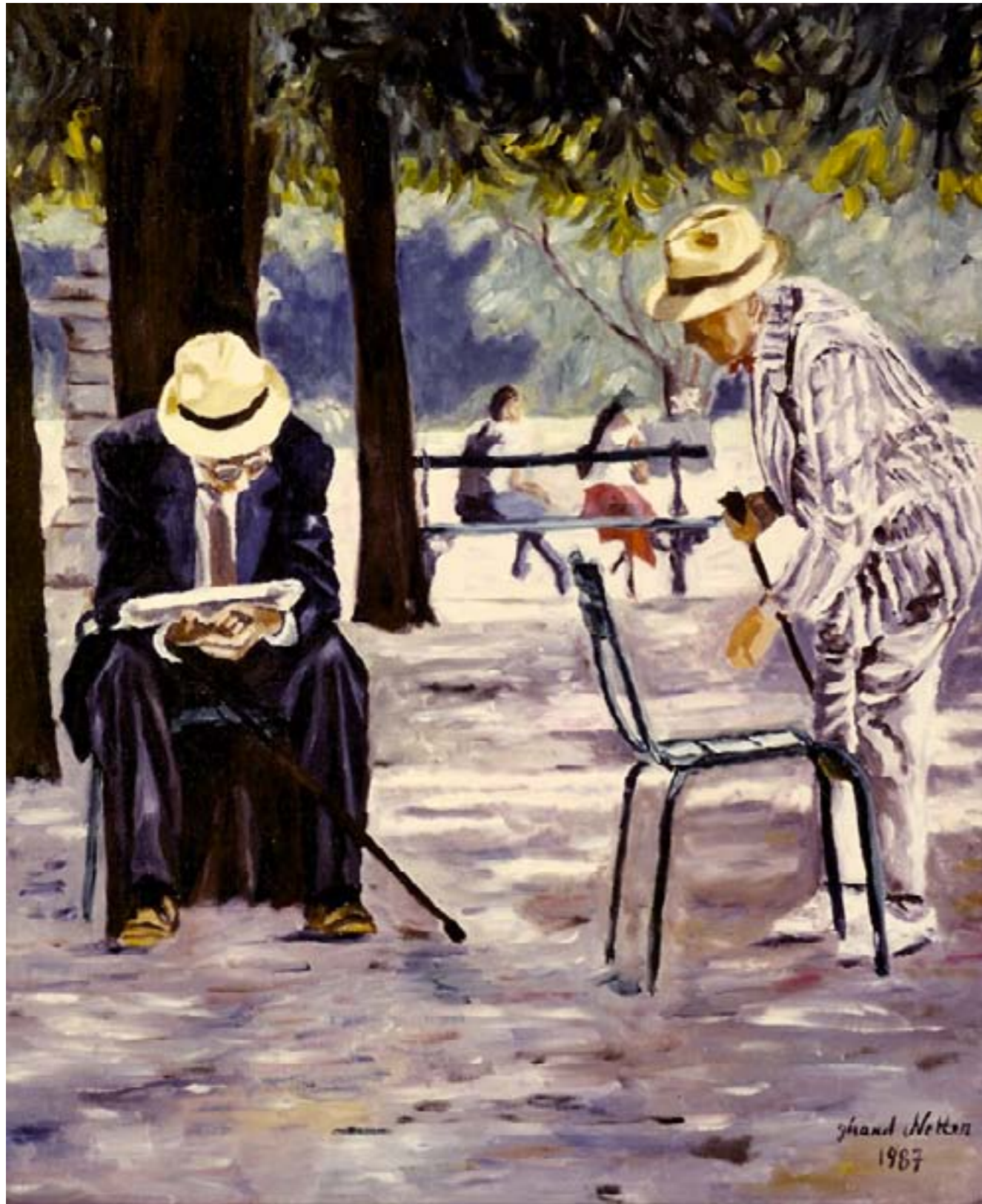
La montée des périls – huile sur toile – 55 x 46 cm

C'est l'été à Paris Un homme lit son journal, Dans le jardin du Luxembourg .