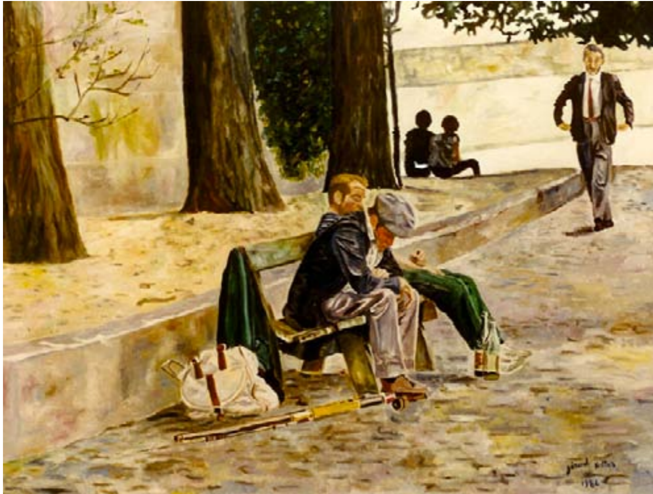
Rutabaga et Topinambour – huile sur toile – 130 x 97 cm -

Vous les verrez peut-être sur le bord d'un trottoir, Dans une controverse, tous les deux s'agiter, Avec une frénésie de comprendre et savoir, Un peu comme l'auraient fait Bouvard et Pécuchet