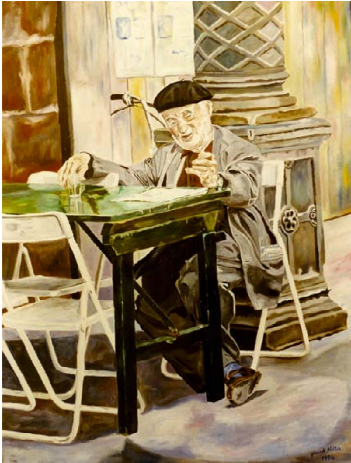
Le vieil homme – huile sur toile – 130 x 97 cm

De loin on pense voir un vieil homme harassé, N'attendant plus grand chose, usé par les années, Tirant de son passé des leçons d'amertume, S'enfonçant, un peu plus, tous les soirs dans la brume,